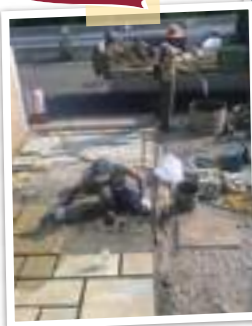
乱形石のヨークシャーストーンとレンガ