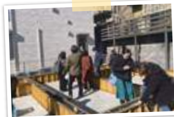
年明けにスタッフみんなで現場見学した様子

通常業務を行いながら、スタッフみんなで少しずつ事務所の外構施工を行っています。完成にはまだまだ時間がかかりそうですが楽しみながら進めています。いろいろな施工をお見せ出来るように事務所の外構にたくさんの資材を使用する予定です。