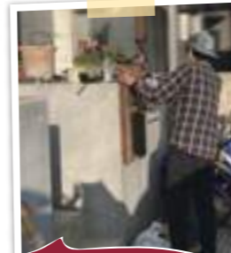
無機質なRC擁壁にウッドパネルを手作りし、照明やインターフォン、ポストを取付け