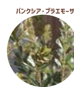
パンクシア・プラエモサ