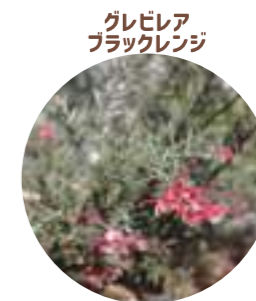
グレビレア ブラックレンジ