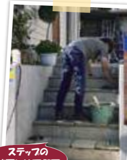
ステップの踏面には天然石