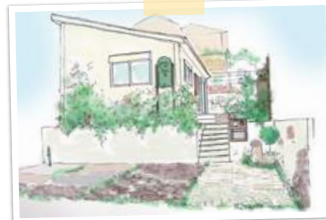
事務所イメージイラスト