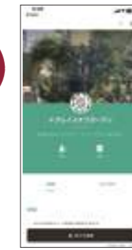
プロフィールページの「追加」をクリック