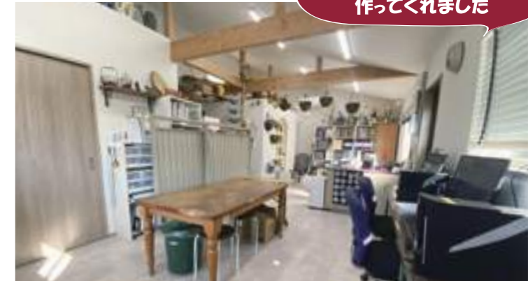
奥の小部屋を工事が作ってくれました