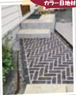
ダークな色のレンガにカラー目地材