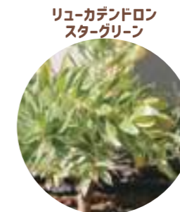
リュウカデンドロン スターグリーン