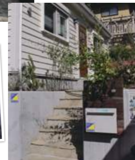
日当たりの良い場所にオージープランツバラや草花と一緒に植え込んで楽しみます