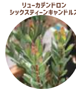
リュウカデンドロン シクスタインキャンドルズ