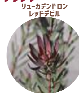
リュウカデンドロン レッドデビル