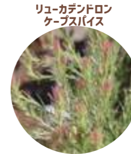
リュウカデンドロン ケーブスパイス