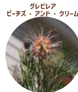
グレビレア ピーチス・アンド・クリーム