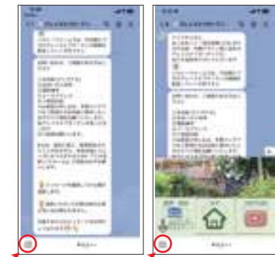
左下の四角いマークをタップしてトークしてください

グレイス 工事部 スタッフの 動画と 作ってます Instagram や YouTube で作業中の動画もUPしたり色々試みる グレイスへ最近もご紹介! 庭づくりに関するさまざまな情報はSNSにて発信!